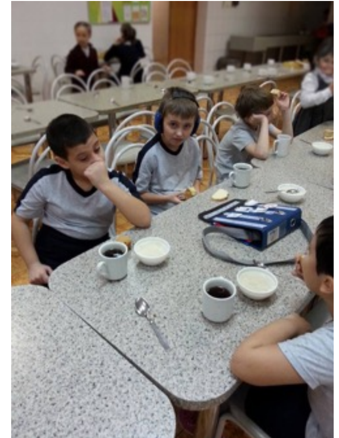
Все вместе на завтраке

После школы ребенку с аутизмом предстоит жить в том же обществе, что и выпускникам обычных школ. Чем раньше они познакомятся друг с другом, тем выше шансы на то, что между ними сложится понимание и взаимодействие. Ребенку с аутизмом, который ходит в школу вместе с обычными детьми, гораздо проще будет ощущать себя частью общества, чем выпускнику коррекционной школы.