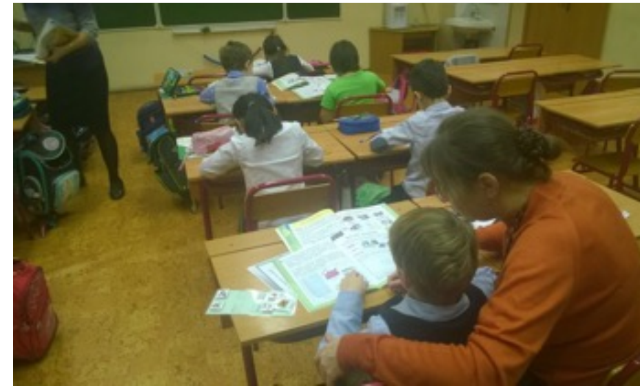
Лев на уроке в сопровождении тьютора.

Для детей с РАС создаются ресурсные классы, в которых проводится подготовка к обучению в обычном классе.