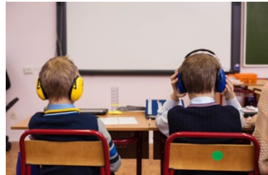
Занятия в сенсорно безопасной и структурированной среде.

Важно помнить, что дети, у которых есть потенциально опасные формы поведения, не включаются в учебный процесс в общеобразовательном классе.