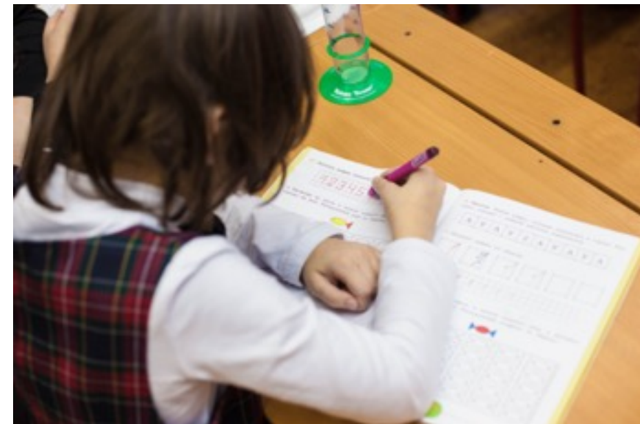
Даша самостоятельно работает на уроке математики

Решения о выборе уроков, которые ребенок будет посещать, об увеличении количества времени нахождения в классе, об уменьшении тьюторской поддержки, согласовываются с учителями общеобразовательного класса. При необходимости учитель ресурсного класса адаптирует учебные материалы под нужды ученика.